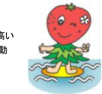
山武市共同実施イメージキャラクター